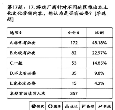
Figure 6. Players' intentions toward localization marketing strategies 图 6. 玩家对本土化营销策略的意向

如图 6 数据显示, 71.15%的玩家(“非常有必要” 48.18%+ “比较有必要” 22.97%)认为游戏厂商针对不同地区推出本土化文化营销内容“非常有必要”或“比较有必要”, 仅 14.00%(“不太有必要” 9.8%+ “完全没必要” 4.2%)持否定态度。这一结果表明, 本土化文化营销已获得多数玩家的普遍认同。受区域文化特征差异的影响, 来自不同国家与地区的玩家对文化融合的感知存在明显差异, 而精细化定价与本土化营销可以弥合这种差异。