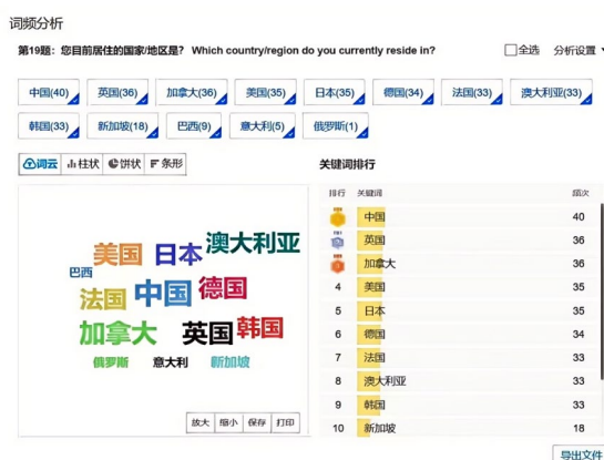
Figure 1. Survey questionnaire response source countries and regions keywords survey results

2026年2月8日至10日，研究者于问卷星平台发布题为“文化消费视角下游戏产品定价与营销调查”的问卷调查，回收有效问卷348份，问卷采用中英双语设计，问卷来源如图1所示，覆盖中国、日韩、东南亚、北美、欧洲等市场，各国样本比例接近，旨在了解玩家对游戏中文化元素的态度、游戏产品定价接受度及对文化营销活动的看法。