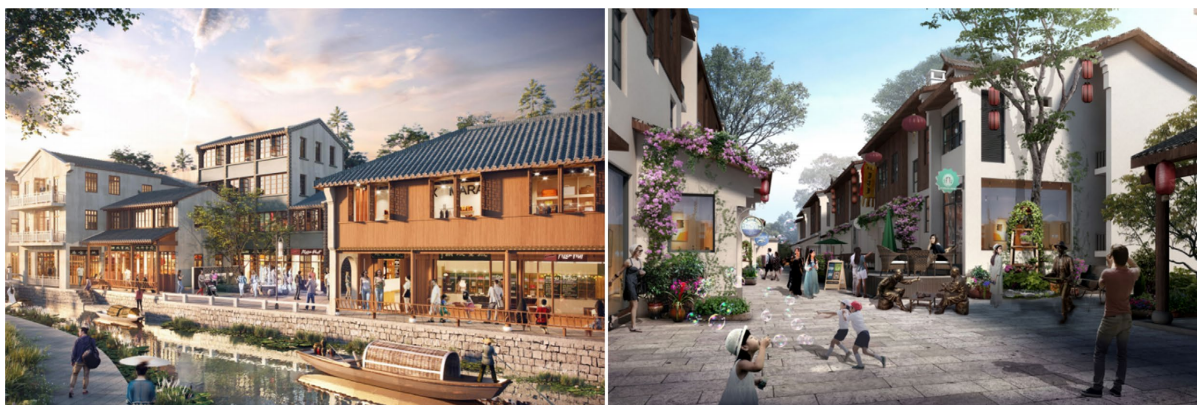
Figure 4. Renderings of architectural style and characteristic nodes