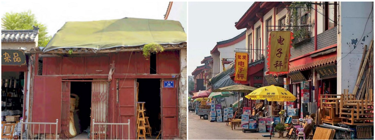
Figure 2. Photos of the current style (left) and business format (right) of the block 图 2. 街区现状风貌(左)与业态(右)照片