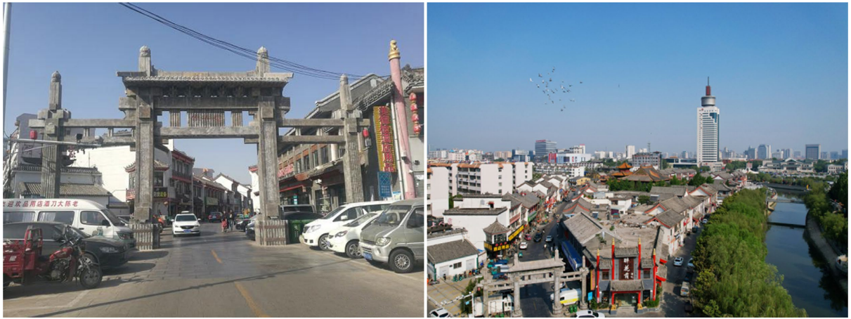
Figure 1. Photos of the current traffic (left) and public space (right) in the block 图 1. 街区现状交通(左)与公共空间(右)照片

之间的风貌层次不齐(图 2)。经过实地调研发现,一些底层商铺也存在乱改增加牌匾字号,广告牌等情况,导致街巷风貌混乱的景象。