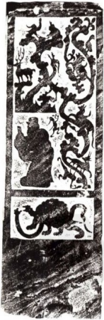
Figure 2. Stone Relief from the Right Vertical Frame of the Tomb Gate at Guchengtang, Yulin, Shaanxi.

图 1. 陕西绥德延家岔二号东汉墓墓门