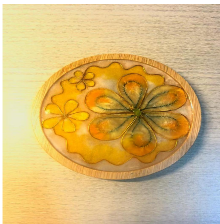
Figure 1. Golden fleece raft 图 1. 金绒花筏

元素融合是两种工艺结合的核心，需从纹样、色彩、材质三个维度进行提取与重构。纹样：提取景泰蓝吉祥纹样与绒花花卉造型，结合校园文化符号(如校花、标志性建筑轮廓)，通过抽象、简化等手法，形成具有现代感的融合纹样“见图1”。色彩：以景泰蓝的经典蓝色为基调，搭配绒花蚕丝的明快色彩，构建既能体现传统辨识度又符合青年审美的校园色彩体系，并针对不同产品场景调整色彩搭配“见图2”。材质：实现金属与丝质的材质互补。以景泰蓝的硬朗质感作为结构支撑，局部点缀绒花的柔软形态，通过“主体 + 点缀”或“基底 + 嵌饰”的形式“见图3”，平衡整体质感，丰富产品的层次感与体验。