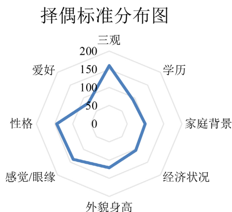
Figure 1. Distribution of mate selection criteria 图 1. 择偶标准分布图

从恋爱观方面来看,如图 1 所示,被调查群体的择偶标准侧重各有不同,呈现多样化的趋势,而三观与性格这两种因素占比却远超其他选项,相较于考虑家庭背景与经济状况等现实因素,她们倾向于考虑三观、眼缘等主观因素,对于恋爱与婚姻选择趋于个性化。也表明了她们并不会为了打发时间、消解寂寞等浅层表面的原因而开始一段恋爱,表明该群体积极追求健康且良性的恋爱关系。