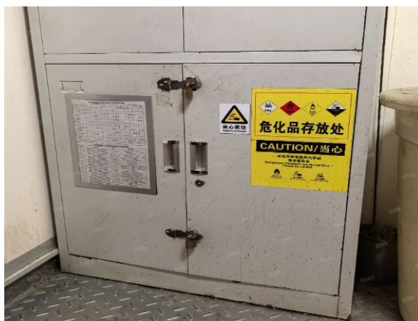
Figure 4. Laboratory hazardous chemical cabinet 图 4. 现场实验室危化品柜