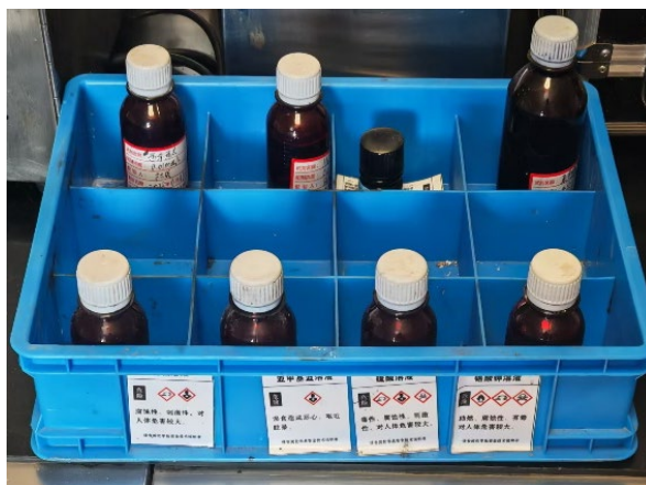
Figure 3. Laboratory hazardous chemical box 图 3. 现场实验室危化品盒