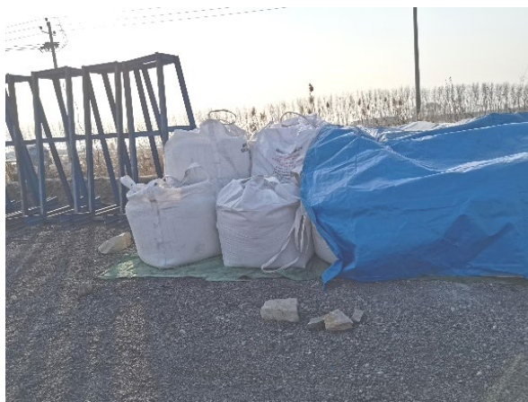
Figure 1. On-site chemical storage area 图 1. 化学品现场存储区