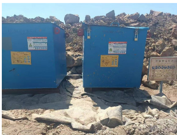
Figure 2. NaOH storage area 图 2. 烧碱存储区