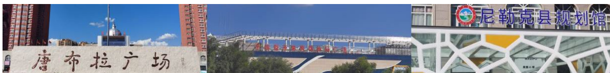
Figure 6. Place identification sign