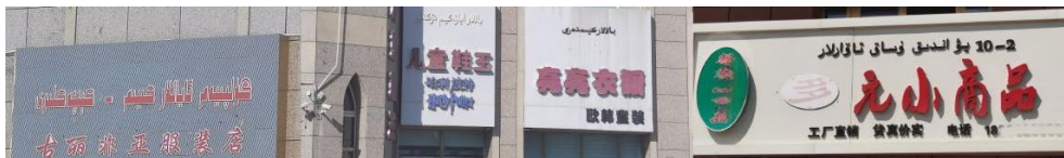
Figure 16. Sign without numbers