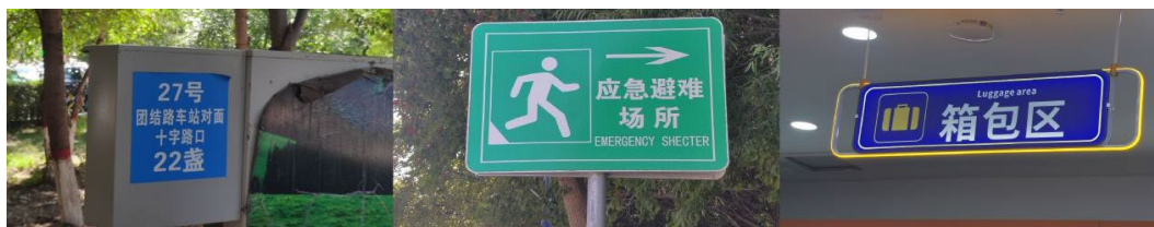
Figure 5. Place identification sign 图 5. 场所标识牌