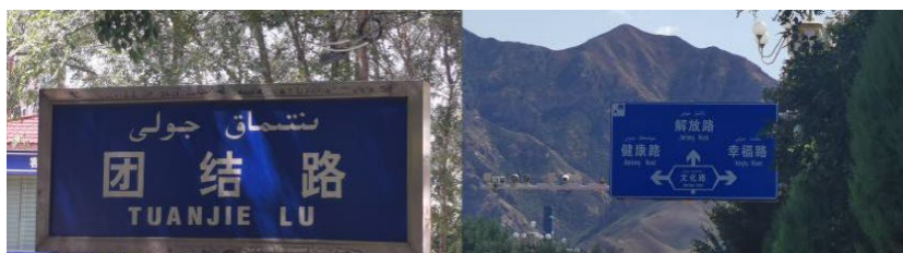
Figure 1. Guideboard 图 1. 路牌