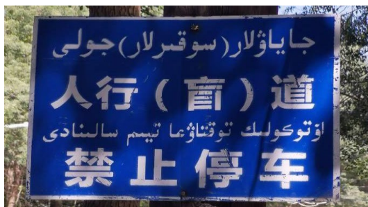
Figure 3. Warning sign 图 3. 警示牌

这一类主要是用来记录禁止性命令和要求的标牌，表示“此处不允许从事某种行为”，如图 3 所示。