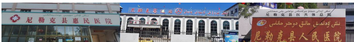
Figure 7. Corporate and institutional identification signs