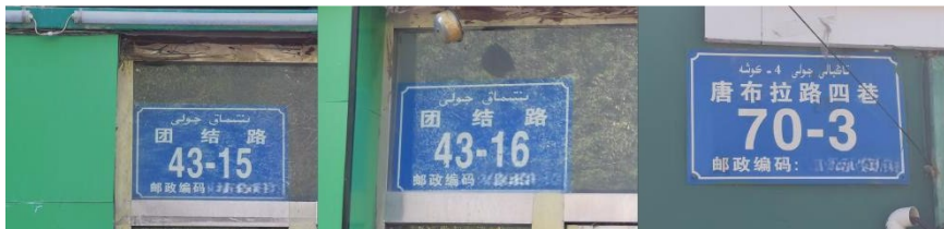
Figure 2. Doorplate 图 2. 门牌