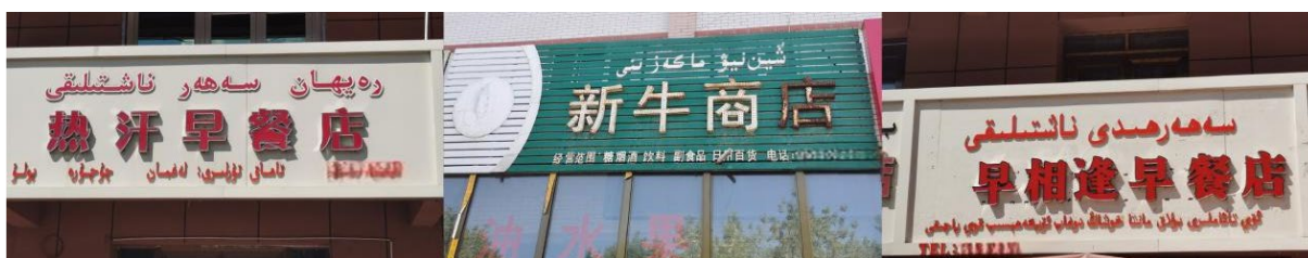
Figure 13. Chinese and Uyghur signboards 图 13. 汉语和维吾尔语标牌