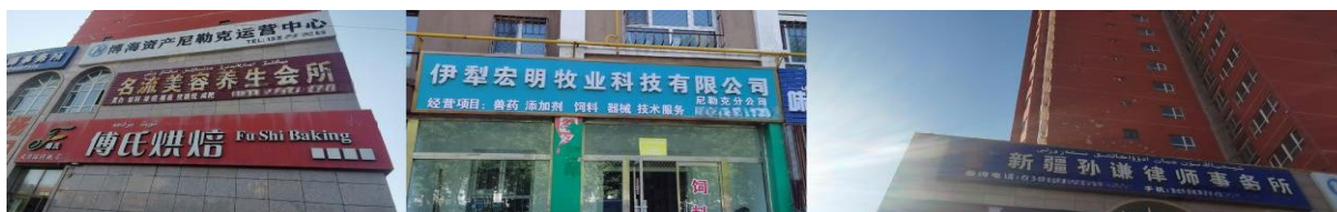
Figure 8. Company institution nameplate