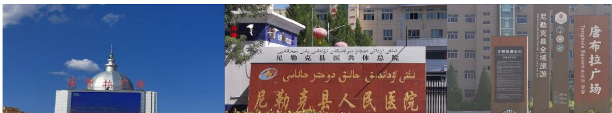
Figure 14. Single-language, bilingual and multilingual types of signs 图 14. 单语、双语、多语三种类型标牌

在多语并存的语言环境中，官方语言或主导语言(如汉语)通常被置于更规范、更显著的位置。路标牌、交通指示牌等公共标牌上所选择的语言，直观地映射了社会中的语言权势结构和群体地位差异。尼勒克县官方标牌中，以单语、双语、多语三种类型为主，汉语一直占据优势地位，得到了官方和使用人群的双重认可，同时也体现了本地居民对汉语语言身份的高度认同。此外，还发现英语是优势外语，在标牌上提供英文可以方便外籍游客，为身处异国他乡的外籍人士找到民族身份认同感和归属感。如图 14 所示。