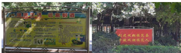
Figure 4. Promotional signs 图 4. 宣传牌

用于传递信息的标牌统称为信息牌。信息牌又可分为以下两类：一、宣传牌：主要是如图 4 所示的正面、积极向上的标语、广告。