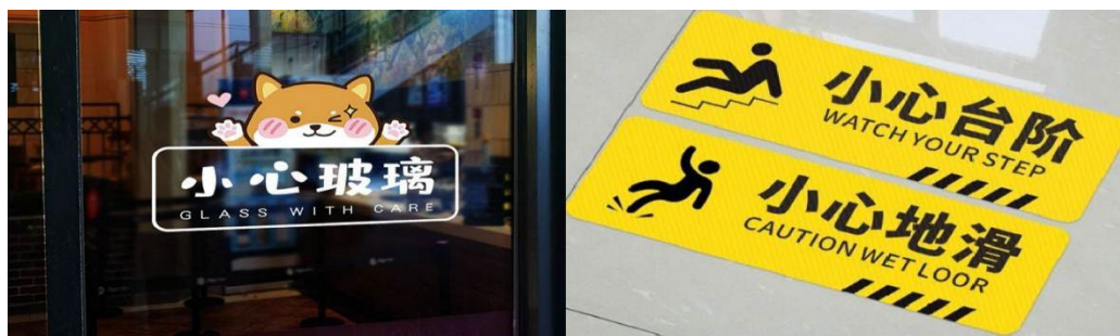
Figure 11. Notice board 图 11. 提示牌

本次调查，获取有效标牌共计 286 个，其中官方标牌 84 个、机构标牌 34 个、私有标牌 168 个。