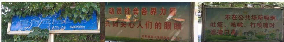
Figure 15. Old signboards

标牌体现着一个城市的面貌，应当清晰且醒目，而标牌老旧，会影响人的体验感。如图 15 所示。