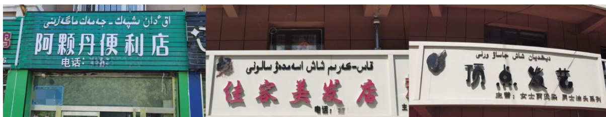
Figure 12. Chinese and Kazakh language signs 图 12. 汉语和哈萨克语标牌

成为语言景观研究的热点。国家机关设立的官方标牌主要为了贯彻国家语言政策和反映国家意识形态，汉语是我国的通用语言，具有不可替代的重要地位。因此，无论是官方标牌、机构标牌还是私有标牌，中文始终占据主导地位。根据调查结果可知，从官方标牌来看，汉语占据绝对优势，且中文始终处于优先位置、字体面积较大，这说明汉语在尼勒克县官方语言景观中拥有绝对的语言权势地位。此外，在私有标牌中，双语标牌居多(汉语和哈萨克语标牌、汉语和维吾尔语标牌)，如图 12、图 13 所示。这是因为尼勒克县哈萨克族、汉族、维吾尔族居多。