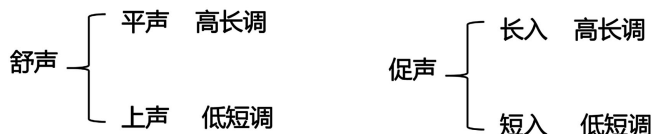
Figure 1. “Shu vs. Cu” classification

王力有条件地接受了段玉裁的“古无去声说”，两人虽都主张上古没有去声，但具体的调类不同，段氏认为上古只有平上入三个声调，而王力主张上古有四个声调，按“舒”“促”分为两大类，舒声分为平、上，促声分为长入、短入，见图 1：