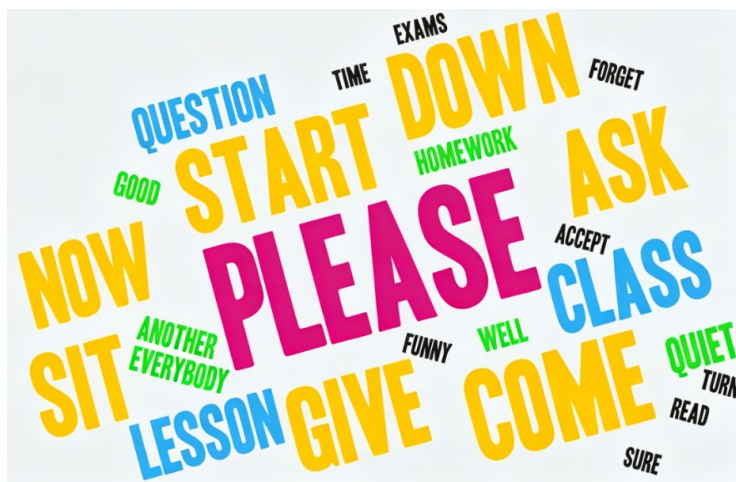
Figure 2. Word cloud of classroom utterances from Mind Your Language

本研究以情景喜剧 Mind Your Language 中英语课堂教师功能性用语为封闭语料,经去重、无关筛选整理得到有效课堂话语共 89 句,拆分为小句后为 96 句,采用人工标注与词频统计相结合的方式,对文本中课堂用语词汇进行频次统计,剔除冠词、介词、连词等无实义功能虚词,聚焦实义教学课堂词汇开展描述性分析,探究英语本族语教师课堂用语的词汇频次分布特征,见图 2。