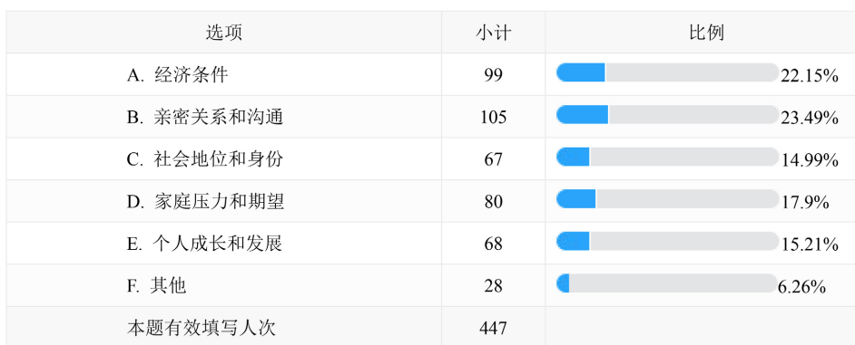
Figure 3. The most important factor in the marriage of outsiders in Shanghai

现代上海市民在选择配偶时，也受到个人价值观念的影响。人们普遍对“门当户对”这一传统观念的认可度较高，但同时也有越来越多的人重视生活方式和个人价值观念方面的匹配。调查发现(见图 3)，上海外地人认为婚姻中最重要的因素是亲密关系和沟通(23.49%)，其高于经济条件占比(22.15%)。调查说明沟通已成为超越物质基础，成为维持婚姻幸福与稳定的重要因素。这种变化表明，尽管传统价值观仍有一定影响，但现代人们更倾向于用自己的价值观，用新的标准来定位婚姻。