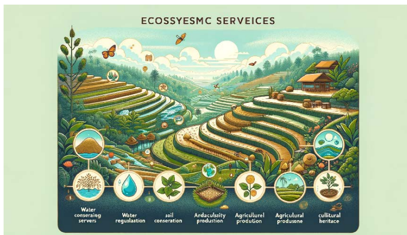
Figure 1. Schematic diagram of the terrace ecosystem services