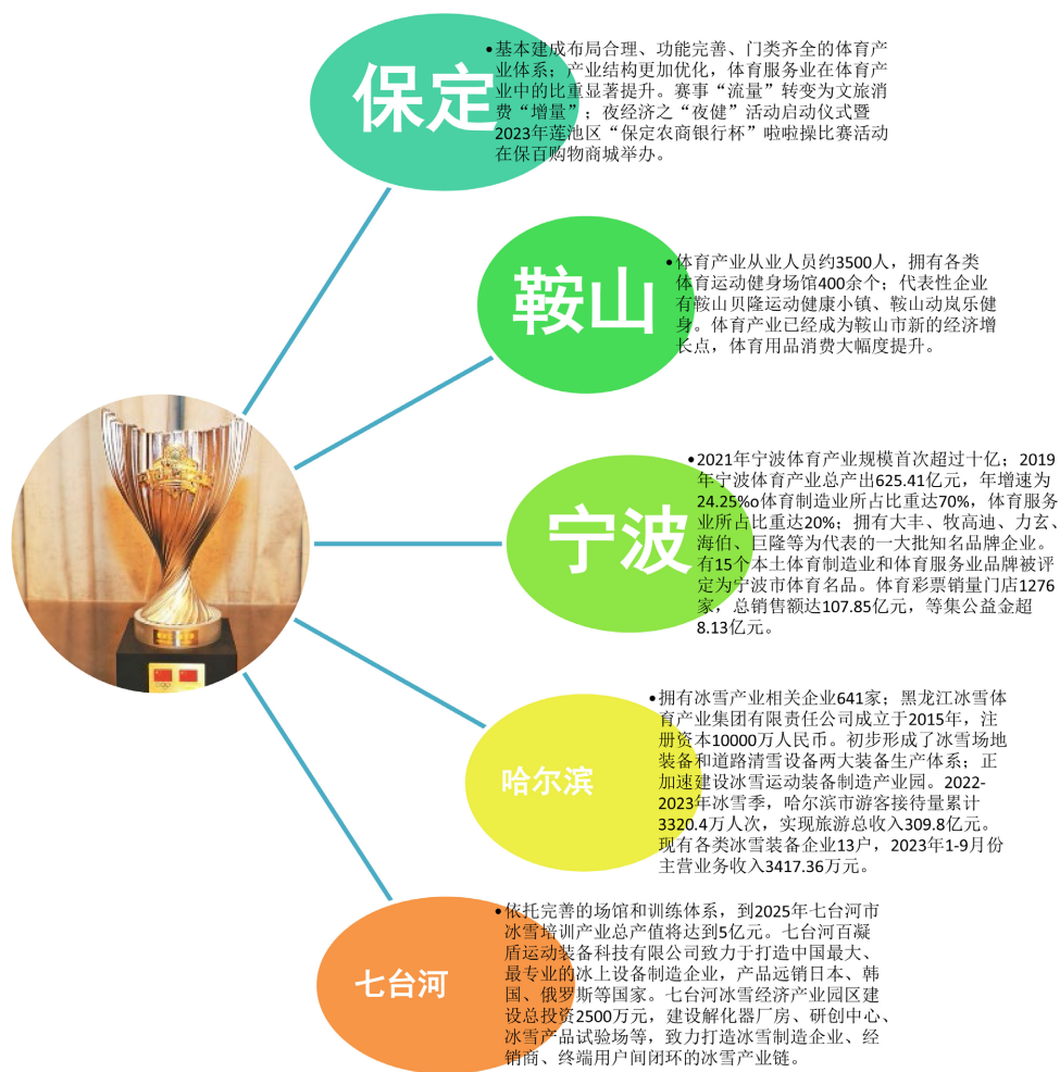
Figure 4. Analysis diagram of the sports industry and sports economy in the Olympic champion city 图 4. 奥运冠军之城体育产业、体育经济分析图