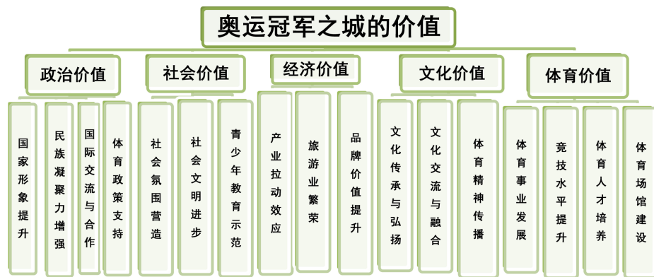
Figure 5. Value structure analysis diagram of the Olympic champion city 图 5. 奥运冠军之城的价值结构分析图