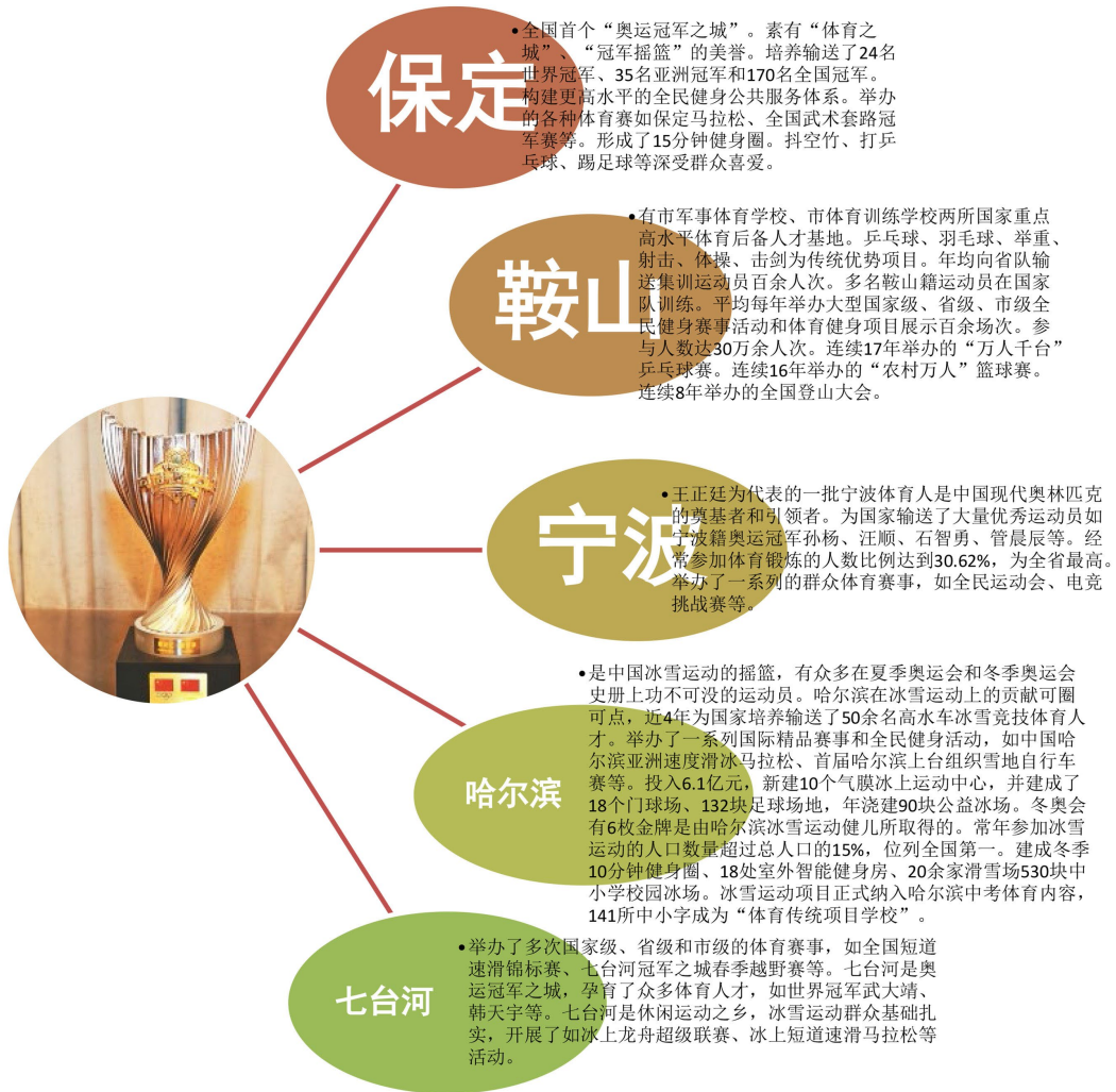
Figure 1. Analysis diagram of cultural heritage and sports atmosphere in the Olympic champion city 图 1. 奥运冠军之城文化底蕴、体育氛围分析图

保定市因其悠久的历史和丰富的文化遗产而闻名。它是河北省的文化中心，拥有众多的博物馆、纪念馆和历史遗址，如保定直隶总督署、古莲花池等。此外，保定市还是中国著名的体育城市之一，拥有良好的体育设施和浓厚的群众体育氛围。保定市多次成功举办了大型体育赛事，如马拉松赛等，这些活动不仅提升了城市的知名度，也增强了市民的体育意识。鞍山市是中国重要的钢铁工业基地，其文化底蕴主要体现在工业文化方面。鞍山市有多个钢铁工业博物馆，展示了该市在钢铁生产方面的辉煌成就。同时，鞍山市也有一定的体育设施和运动传统，但由于其工业背景较重，与体育相关的文化氛围可能不如其他以体育闻名的城市浓厚。宁波是中国东部沿海的一个重要港口城市，其文化底蕴主要源于海派文化。宁波的开放和包容性形成了独特的商业文化和海洋文化。宁波也是中国体育的重要城市之一，曾在奥运会上取得优异成绩。宁波的体育氛围较为浓厚，有多处体育设施，并且市民普遍对体育活动有着较高的热情。哈尔滨位于中国东北部，以其冰雪文化和音乐之城著称。哈尔滨每年举办的冰雪节吸引了大量游客，这也是该市文