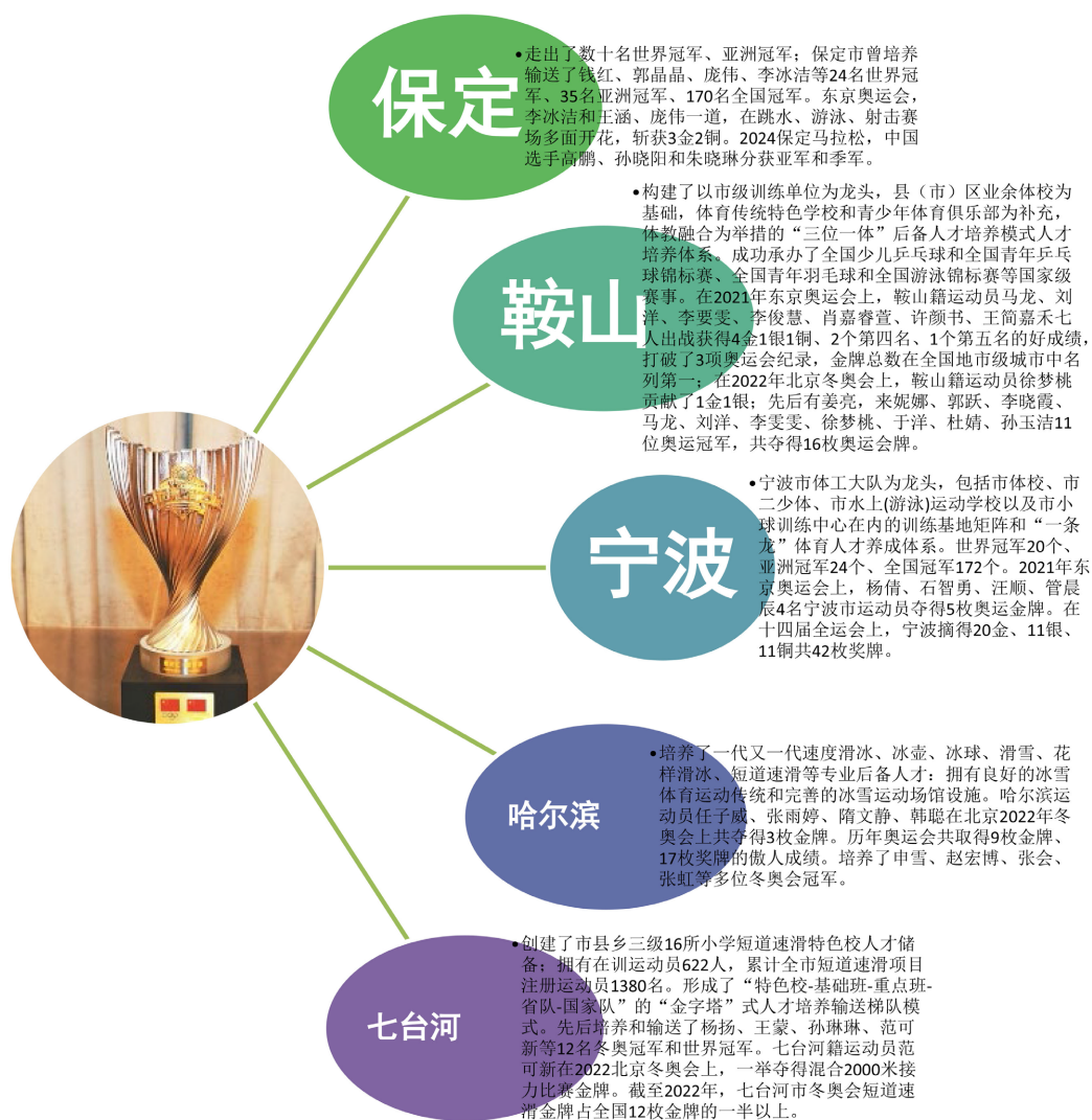
Figure 3. Analysis diagram of reserve talent cultivation and competitive results in the Olympic champion city 图 3. 奥运冠军之城后备人才培养和竞技成绩分析图

系列新场景。还积极开展体育旅游精品线路及户外运动目的地的推广活动，展示了丰富的户外运动场地设施资源。鞍山市大力发展城市体育文化，积极探索构建独具特色的城市体育文化和产业经济生态圈，让体育文化融入现代生活，促进体育事业高质量发展。宁波向全球推广城市形象、发展体育产业。重点发展了海洋运动休闲和竞赛表演，并且提出了到 2025 年体育产业总规模超 300 亿元的目标。通过承办世界排球联赛、宁波国际赛车系列赛、宁波国际马拉松等大型体育赛事提升城市的知名度的同时，带动当地的旅游业和其他相关产业的发展。哈尔滨市在发展冰雪经济方面具有得天独厚的优势。正积极抢抓后冬奥发展机遇，全力打造冰雪体育休闲运动宝地、国际冰雪体育赛事重地、冰雪体育人才培养高地。高标准建设现代化体育名城、冰雪体育强市，聚力推动体育事业发展走在全国全省前列。七台河市从“冰雪 + 体育”、“冰雪 + 文化”、“冰雪 + 旅游”、“冰雪 + 装备”等多角度做强冰雪体育经济。七台河市百凝盾运动装备科技有限公司致力于打造中国最大、最专业的冰上设备制造企业，产品远销日本、韩国、俄罗斯等国家。综上所述，各奥运冠军之城依据本地特点，发展了具有地方特色的体育产业，通过各种方式将这些体育成绩转化为经济价值和社会影响力(见图 4)。