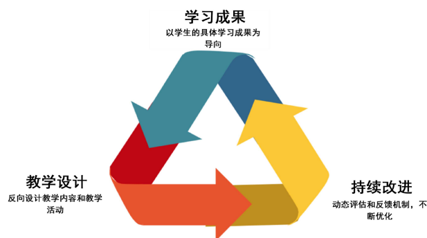
Figure 1. The three-stage model under the OBE concept 图 1. OBE 理念指导下的三阶段模型

阶段 3: 开发评价工具。OBE 理念下的教学设计强调成果可测量,因此在评价工具的开发上,应当根据双维目标设计具体的评价标准。在语言评价方面,可以采用传统的听说读写译测试,例如口语课堂测试或读写阶段性测试;而在思政评价方面,除了显性评价,如通过课堂活动中的情境判断题评估学生对文化多样性的理解和跨文化沟通的能力,还可以设计隐性评价工具,如小组合作中的责任感和团队精神的观察量表。三阶段模型如图 1 所示: