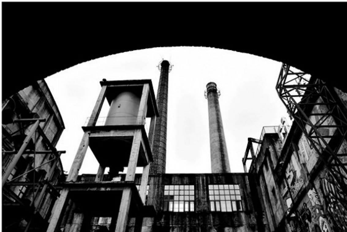
Figure 2. Old factory, old photos 图 2. 老工厂旧照