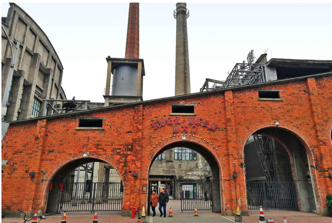
Figure 3. Newly built Music Park 图 3. 新建音乐公园